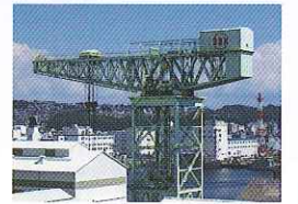
SSK(佐世保重工業) ジャイアントカンチレバークレーン