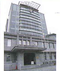
海上自衛隊佐世保史料館