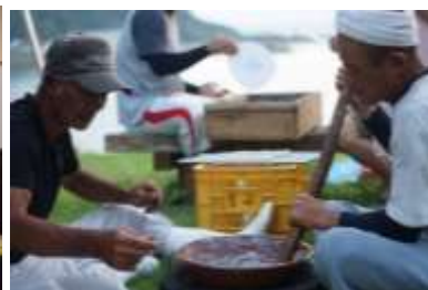
高島ちくわ作り体験