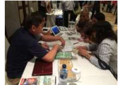
国際誘致セールス(インドネシア商談会)

JR九州と長崎県、熊本県は共同で集中送客キャンペーン「どっちがウイッシュ?長崎VS熊本」が開催されるにあたり、PRイベントが博多駅前にて行われました。平成28年秋に開催する長崎デスティネーションキャンペーンに向けて盛り上がる「長崎県」と九州新幹線全線開業5周年を迎える「熊本県」の両県の魅力あふれる素材を対決形式で紹介することで、お客さまご自身にどっちが良いか旅の選択を楽しんでいただくものです。当日はキャンペーンタレントのDAIGOさんによるトークショーも行われ、多くの方が集まる中、佐世保のPRを行って参りました。佐世保へ多くのお客様がお越しいただけるよう引き続きPRしてまいります。