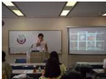
木村氏講義の様子