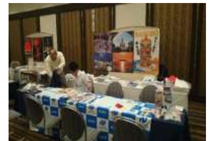
観光情報説明会(東京)