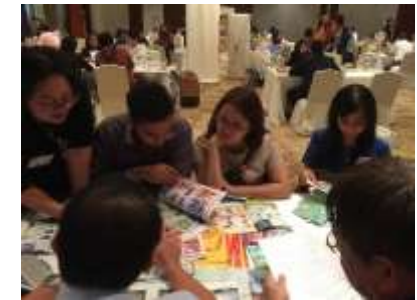
国際誘致セールス(インドネシア商談会)