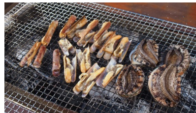
③獲れたマテ貝をBBQスタイルで