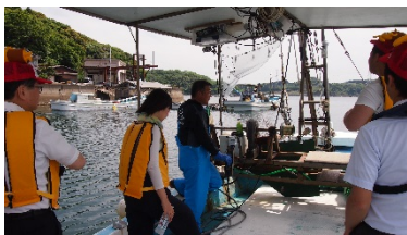
③赤マテ貝漁の様子

ハウステンボスと連携し、佐世保・九十九島の観光情報を掲載しました。展海峰、九十九島パールシーリゾート、海風バス、佐世保グルメを紹介しました。