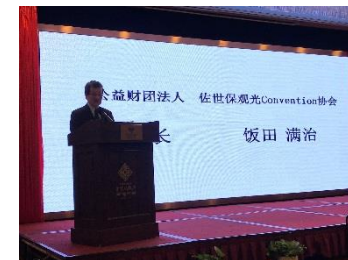
観光情報説明会(中国)

前回10月の入港より5ヶ月ぶりにぱしふいっく・びいなすが入港いたしました。今回は乗船のお客様に対して佐世保港クルーズのツアーを造成して頂き、当日はお天気にも恵まれ大変多くの方にご利用頂くことができました。次回の入港の際にも引き続きご利用いただけるようご案内を続けて参ります。