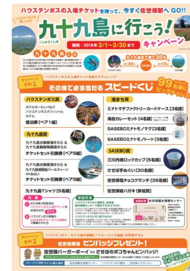
キャンペーンチラシ

平成29年度に使用するパンフレットが完成しました。佐世保市内のホテルや観光施設、佐世保駅構内の佐世保観光情報センターで配布しています。また、WEBサイト「海風の国佐世保・小値賀観光圏」ではPDFデータもダウンロード可能です。(URL) https://www.sasebo99.com/inquiry/pdf/index.cfm