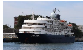
カレドニアン・スカイ号