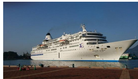
ぱしふいっく・びいなす