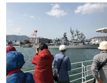
ぱしふいっく・びいなす(軍港クルーズ)