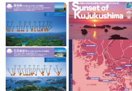
サンセットガイド