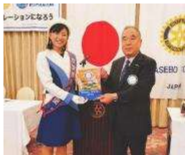
佐世保南ロータークラブでの卓話