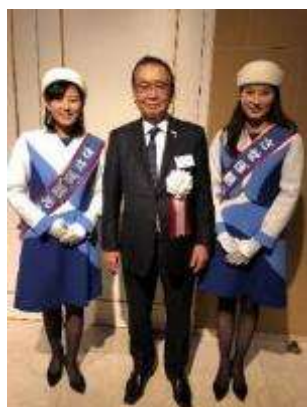
東京佐世保会でのお出迎え