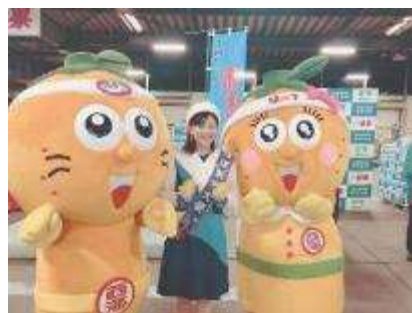
西海みかんのPR(仙台)