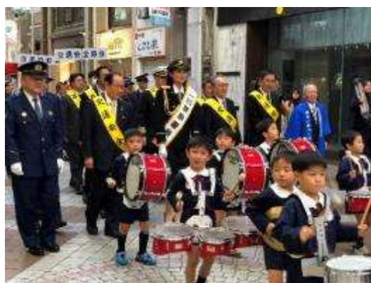
一日警察署長・年末安全パレード