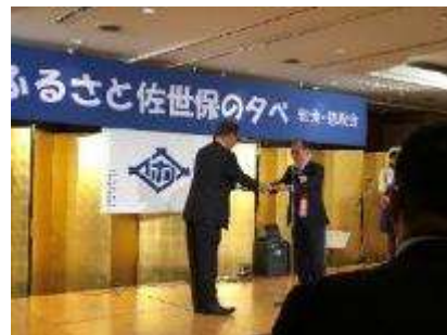
「ふるさとの夕べ」委嘱状交付