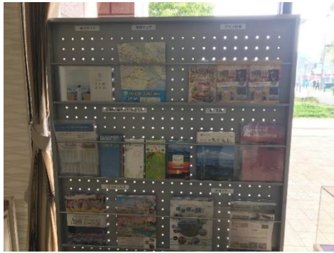
↑佐世保観光情報センター内パンフレットラック

佐世保観光情報センターの窓口が臨時休業中の間、観光客の利便性の向上・案内業務の効率化を図るため、案内販売チーム内で意見交換を行い、情報センター内のパンフレットラックの整理など、お客様が欲しい情報を簡単に見つけていただけるよう点検・整備を行いました。