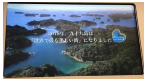
「ドローンでみた九十九島」が放映されている様子