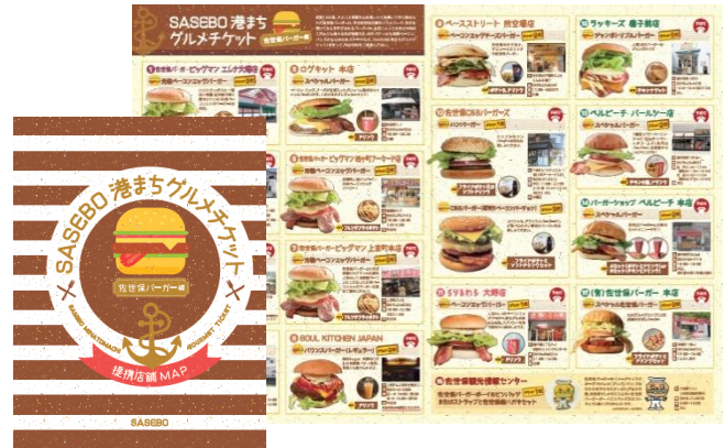
グルメチケット見本