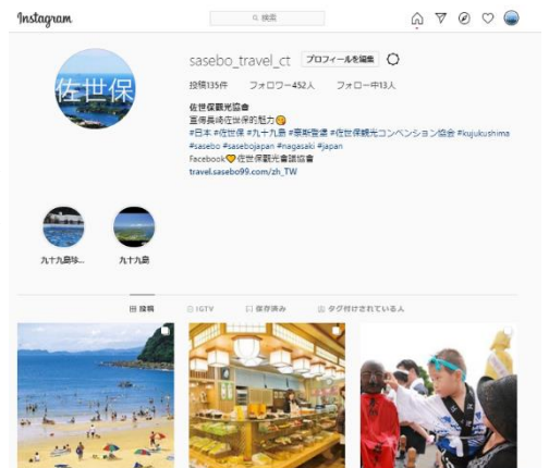
繁体字公式 Instagram アカウント画面

日本や旅行・グルメに興味のある香港在住者に向けて今後も SNS 等を活用し、佐世保の観光情報を発信してまいります。