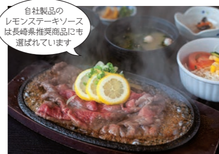
自社製品のレモンステーキソースは長崎県推奨商品にも選ばれています