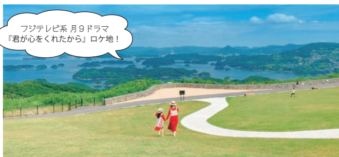
フジテレビ系 月9ドラマ『君が心をくれたから』ロケ地！