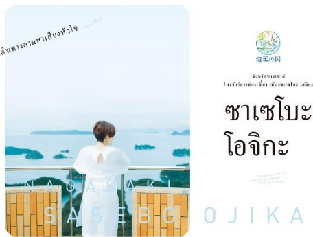
させぼ・おぢか タイ語 表紙