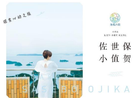
させぼ・おぢか 中国語簡体字 表紙