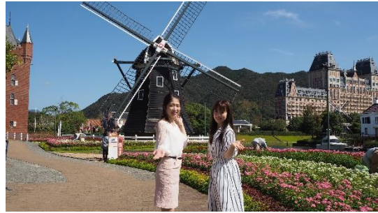
ハウステンボスでの撮影の様子