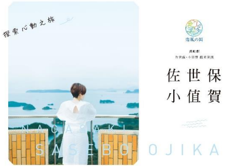
させぼ・おぢか 中国語繁体字 表紙

また今後は、英語版、韓国語版の増刷も予定するなど、需要回復を見据え、受入環境の整備に努めてまいります。