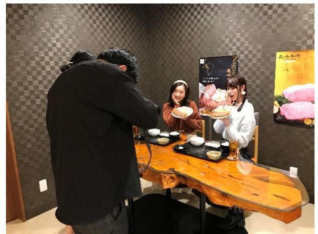
台湾人カメラマン 撮影中の様子