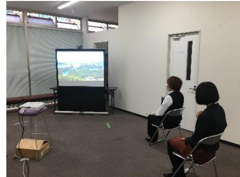
観光マイスター ゴールド検定試験の様子