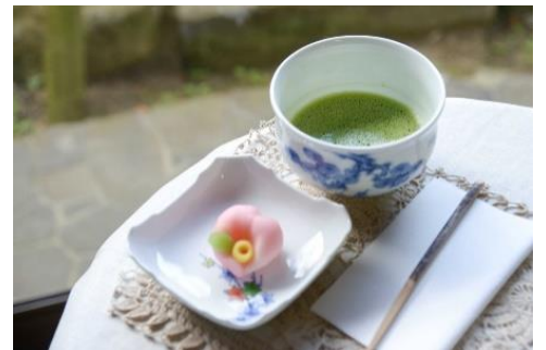
みかわち焼にふれる旅 パンフレット・三川内焼商品の一部