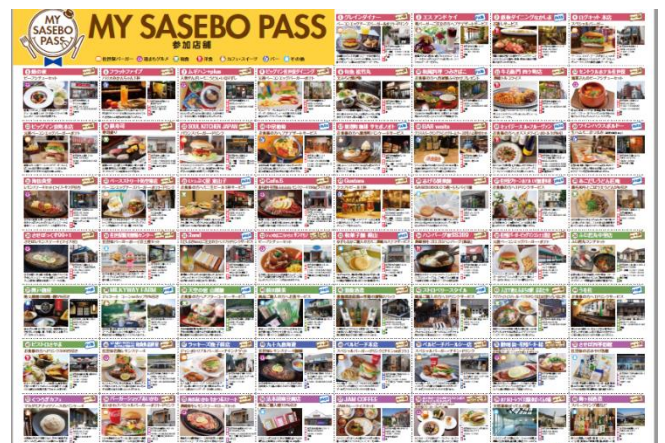
MY SASEBO PASS パンフレット