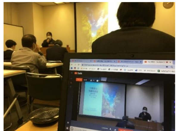
YouTube で配信した講演会の様子