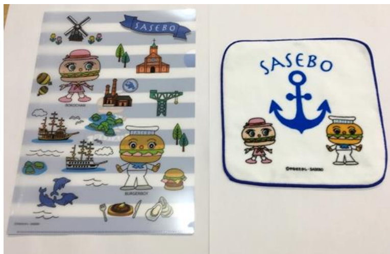
バーガーボーイ & ボコちゃん クリアファイル・ハンドタオル 330 円 (税込)