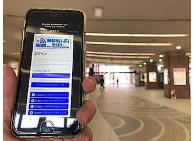
無料 Wi-Fi ログイン画面