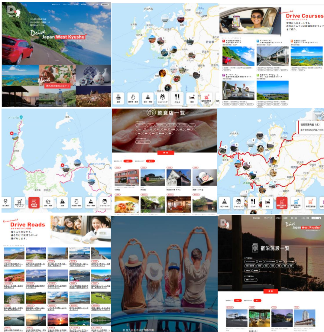
ドライブウェブ「Drive Japan West Kyushu」サイトの一部