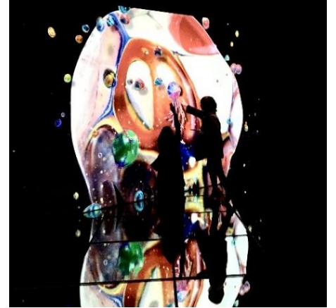
光のファンタジアシティ 展示物の一部