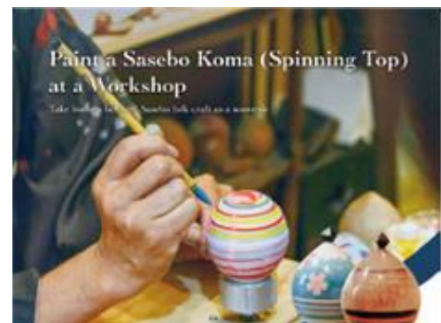
体験プログラム チラシの一部