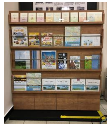
パンフレットラック