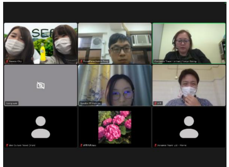
オンライン商談会の様子