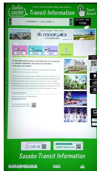
設置したデジタルサイネージ