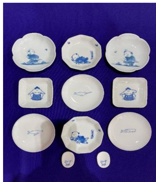
みかわち焼 箸置き 550 円 (税込) 豆皿 1,540 円 (税込)