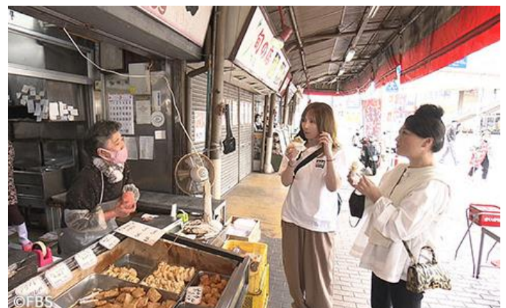
放送された番組の一場面