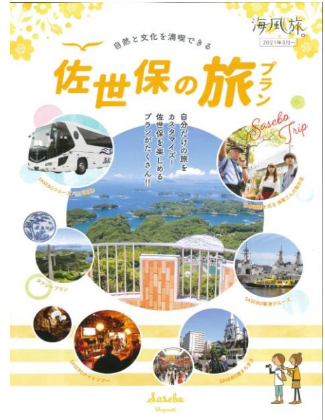
佐世保の旅プラン パンフレット

ガイド付ツアーやタクシーツアー、SASEBO 軍港クルーズ、SASEBO クルーズバス海風、体験プログラム、MY SASEBO PASS など佐世保を楽しめるプランを掲載しており、自分だけの佐世保の旅をカスタマイズするのにご利用いただけます。