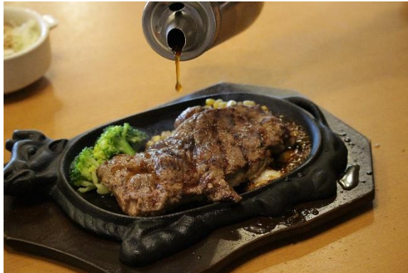
今回撮影した写真の一部