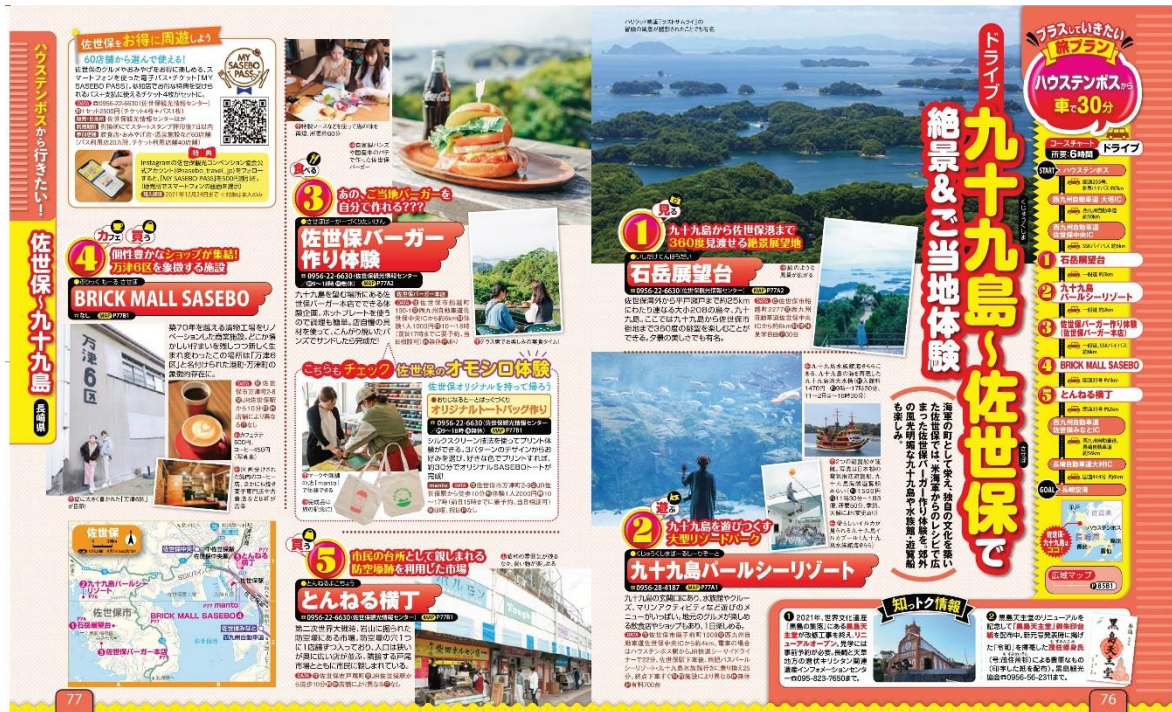
今回出稿した記事の内容