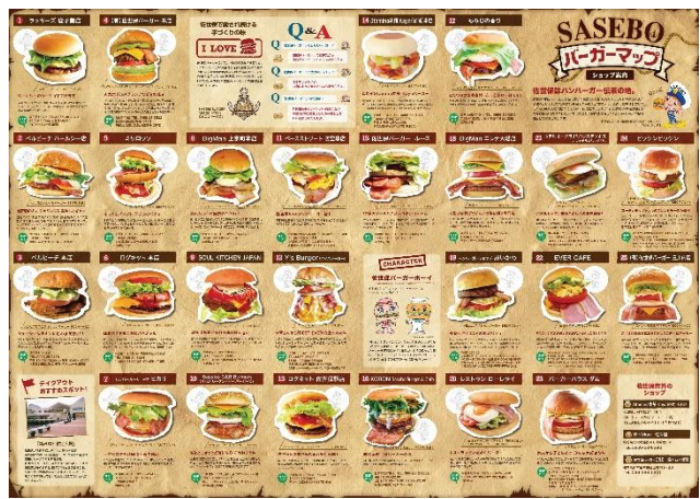
増刷した佐世保バーガーマップ