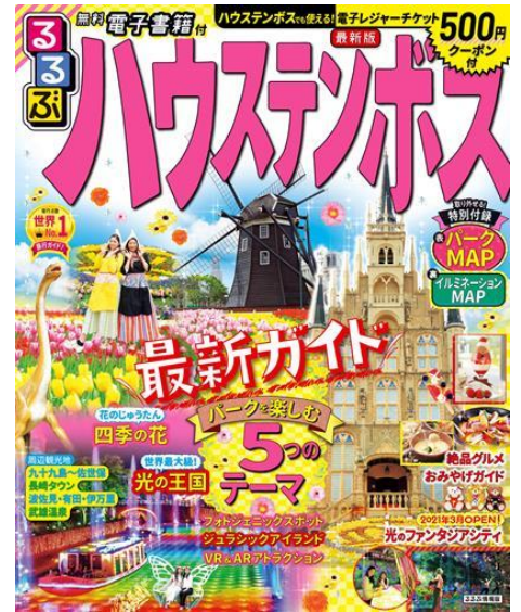
るるぶハウステンボス 表紙

「九十九島」を始め「万津6区」に関する情報や、今年度より当協会が販売を始めた、佐世保市内の体験プログラムを集めた「海風旅。Experience」の中から、「佐世保バーガー作り体験」と「トートバッグ作り体験」についての情報を掲載しております。