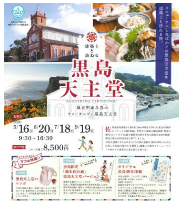
建築士と訪ねる 黒島天主堂 チラシ