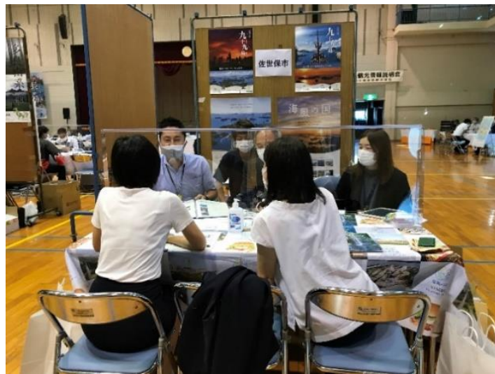
説明会開催中の様子