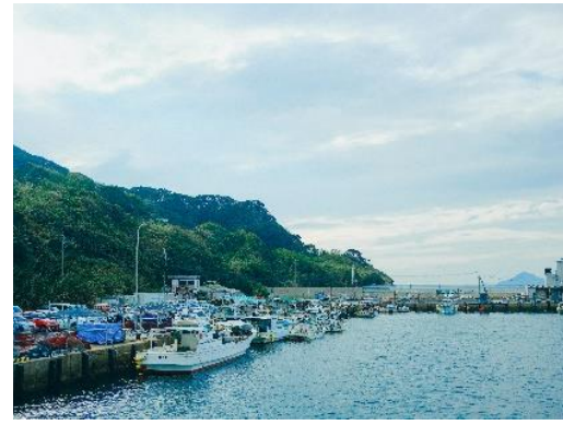
黒島の主な観光スポット