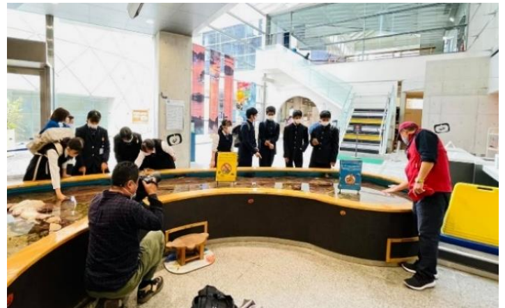
SDGs 探究プログラムを開催している様子

また、同日の夕刻からは、JAZZ SPOT EASELにて、JAZZ 演奏風景の撮影を行いました。撮影後は、ご協力いただいた演奏者の皆さんによる貸切 LIVE が開催されました。市内から多くのファンが集まり、佐世保の夜をあらためて堪能されていました。