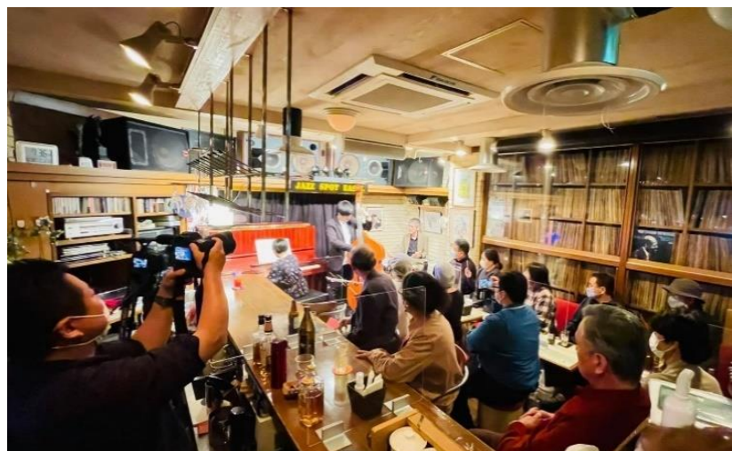
貸切 LIVE 開催中の様子