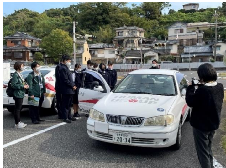
SDGs 探究プログラムのモニターツアーの様子