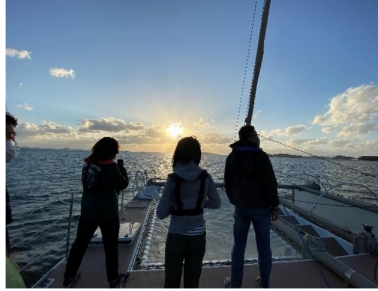
東南アジア市場アドバイザー現地視察の様子