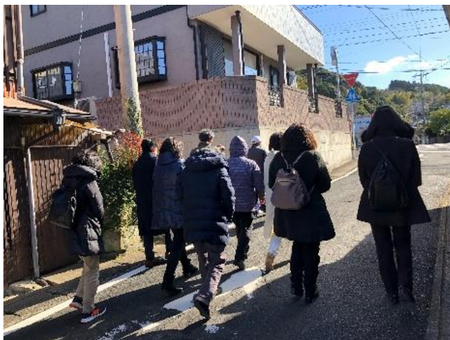
ガイド人材育成研修様子