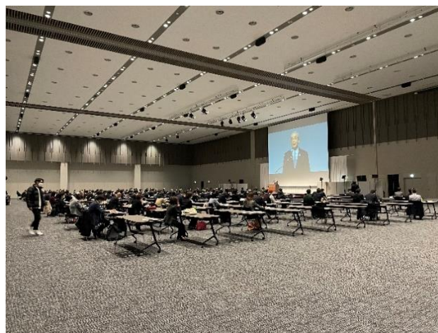
フォーラム開催中の様子