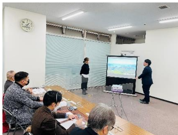
観光マイスターゴールド試験 開催中の様子