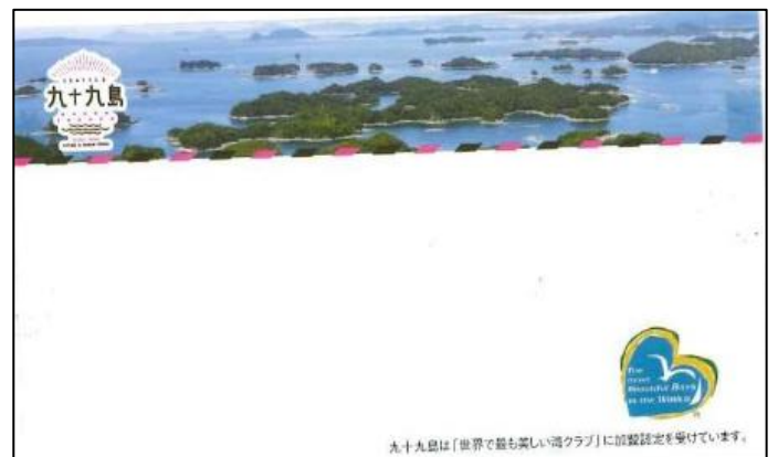
制作した名刺台紙一覧