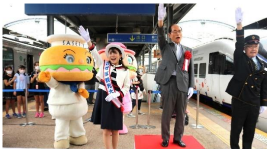
JR佐世保線振り子型車両出発式典