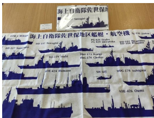
海上自衛隊佐世保地区艦艇・航空機手拭い