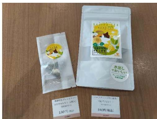
世知原茶とレモンのブレンドティー

佐世保観光情報センター（JR佐世保駅構内）の物販コーナーに新しい商品を入荷しました。