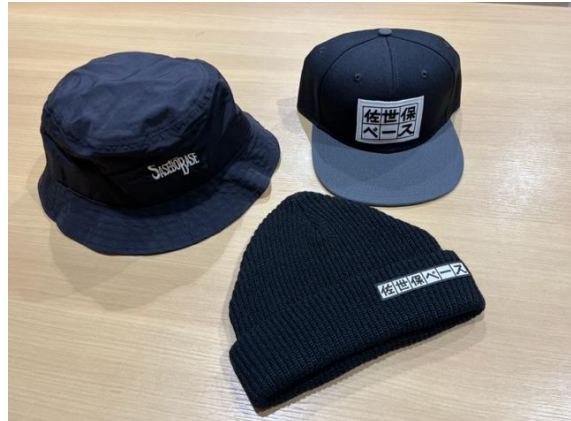
ハット 4,400円・キャップ 5,500円・ ニットキャップ 4,400円