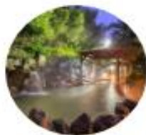
大江戸温泉物語 ホテル蘭風