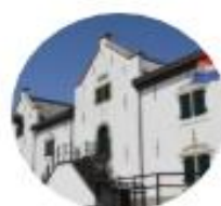
平戸オランダ商館