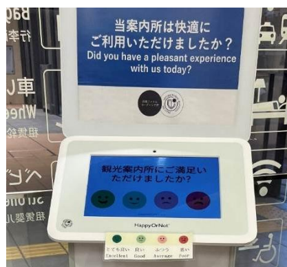
満足度調査の機械