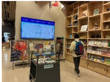
パンフレットラックなど