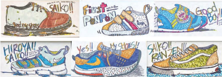
※展示写真はイメージです