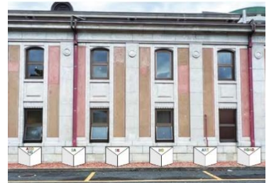
※展示写真はイメージです