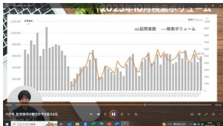
【動画】佐世保観光マーケティングラボ

URL https://www.sasebo99.com/feature/business 佐世保観光コンベンション協会 公式HP内「法人のみなさまへ」から閲覧できます。