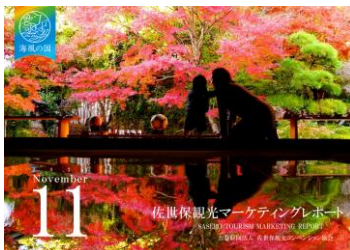
【資料】佐世保観光マーケティングレポート